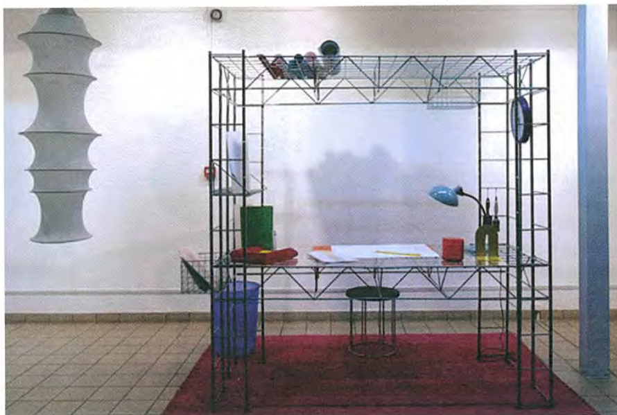
↑ L'Abitacolo de Bruno Munari © Nabil Boutros.

Il est toujours question d'amitié quand Nana Omi, bonne amie des Trois Ourses, dénicher chez un bouquiniste de Prague l'édition originale d'un album de Dobroslav Foll. La richesse plastique et, à nouveau, l'interactivité proposée aux lecteurs, feront qu'elles le rééditeront tout aussitôt ( Ceci ou Cela? ).