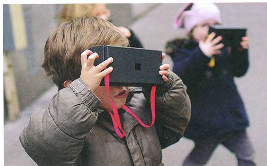
↓ Atelier Tana Hoban. « Regarde bien »