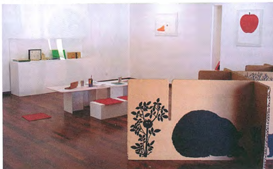
↑ « Lire et jouer avec Enzo Mari » © Photo Les Trois Ourses.