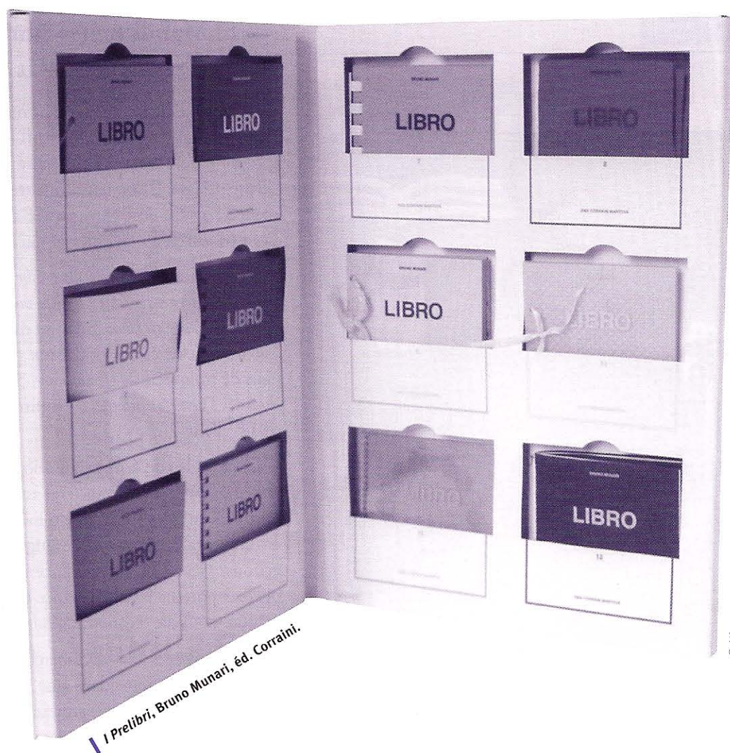
I Prelibri, Bruno Munari, éd. Corraini.

la sérigraphie, utilisant papier, carton, cagette, papier calque, du minuscule au gigantesque, de la spirale à l'emboîtement à charnière métallique, accumule ses productions en renversant les barrières des genres. Louise-Marie Cumont* raconte, dans ses livres en tissu remarquablement composés, les couleurs, les formes, les règles de composition à travers des rêves, des cauchemars, des visages, des personnages qui prennent l'apparence de maisons.